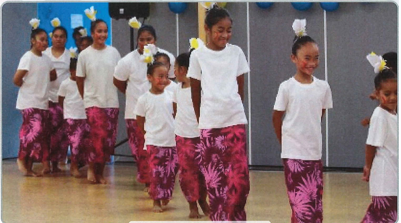
“O LE ALA I LE PULE. O LE TAUTUA”